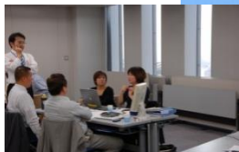
あんしんの年間3000社の参加実績

●将軍の日の由来・・・戦国時代に将軍は戦場から少し離れたところから、戦況を見ながら戦略戦術を練ったことにちなみ、経営者が日常業務から離れ電話も来客もない環境で経営計画を作るこのセミナーを「将軍の日」と名付けました。