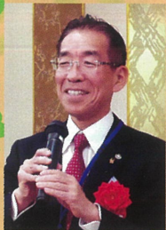
かなた税理士法人 代表社員